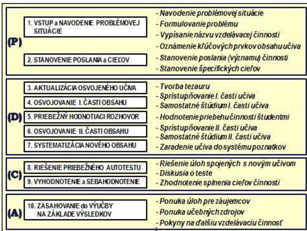
Obr. 2: Štruktúra procesov a parciálnych procesov vo vzdelávacej činnosti s manažérstvom kvality (PDCA cyklus).

Procesný prístup k riadeniu výučby znamená systematicky identifikovať procesy vo výučbe pre dosiahnutie požadovaných výsledkov a nachádzať medzi nimi vzájomné väzby. Štruktúra vzdelávacích činností s manažérstvom kvality v PDCA cykle, akými sú prednášky, cvičenia, semináre a pod. je znázornená na obr. 2 (Blaško 2013).