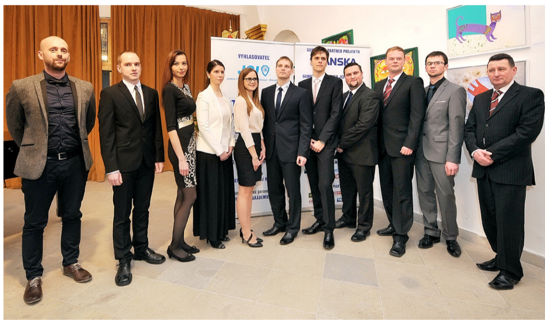
Víťazi jednotlivých kategórií ŠOS 2014/2015.

Cieľom našej aktivity je oceniť študentov VŠ, ktorí študujú na 1., 2. alebo 3. stupni vysokoškolského štúdia, a ktorí sú nielen excelentnými študentmi, ale sú v niečom výnimoční – napr. víťazi alebo medailisti rôznych študentských odborných súťaží v rámci Slovenska, Európy či sveta, úspešní riešitelia rôznych inovatívnych nápadov, doktorandi, ktorí sa môžu preukázať významnými vedeckovýskumnými výsledkami, úspešní umelci či športovci. Veríme, že tak môžeme dostať významné vedeckovýskumné objavy do povedomia širokej verejnosti. Nominovaní však musia spĺňať vekový limit od 18 do 35 rokov.