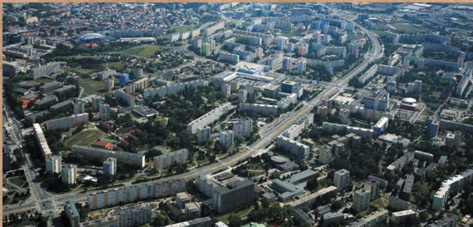
Súčasná Terasa s Lunikmi I až VIII