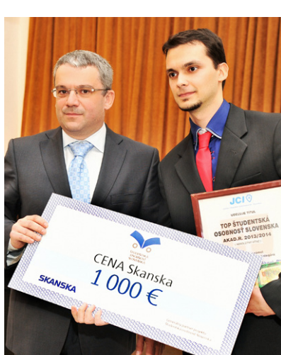
Víťazi jednotlivých kategórií ŠOS 2013/2014

Na zisk ocenenia v roku 2015 je nominovaných celkovo 75 študentov. V každej kategórii nezávislá odborná komisia vyberie víťaza.